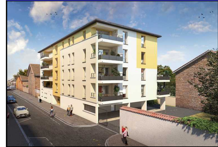
URBAT PROMOTION - Immeuble OXYGENE - 1401, Avenue du mondial 98 CS 68214 - 34965 Montpellier cedex 2