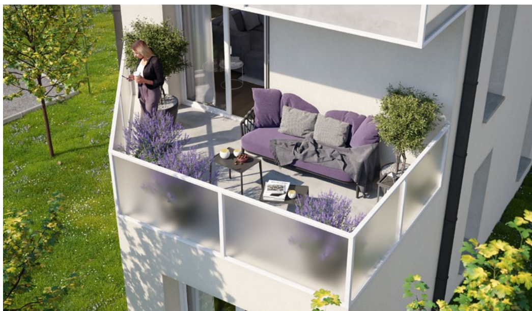
Illustration à caractère d'ambiance - Visuels non contractuels - *Voir plans et notice sommaire