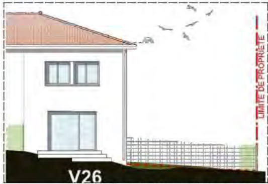
Façade Ouest côté terrasse