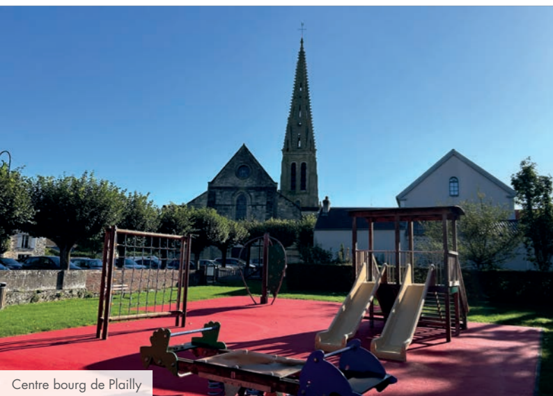
Centre bourg de Plailly

Et si la clé du bonheur était de vous mettre au vert, tout en restant connecté à Paris ? Habiter à Plailly, c'est faire le choix d'une vie rurale avec le Grand Paris en toile de fond. Célèbre pour accueillir le parc Astérix, à proximité immédiate des bassins d'emploi de la grande couronne, reliée au RER D par la ligne de bus R9, la commune collectionne les atouts. L'accès à l'A1 facilite les déplacements en voiture vers le Nord de la métropole.