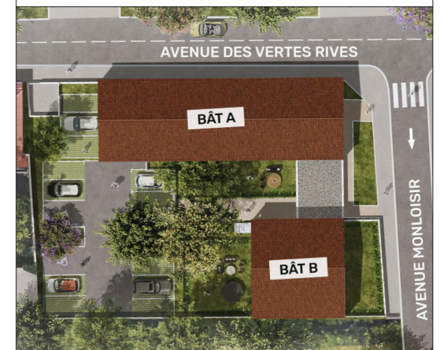
PLAN DE LA RÉSIDENCE