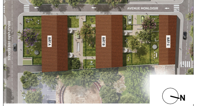
PLAN DE LA RÉSIDENCE