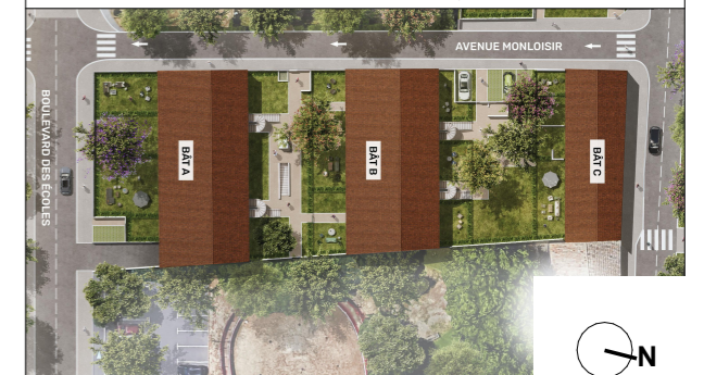
PLAN DE LA RÉSIDENCE