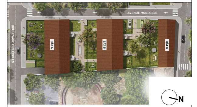
PLAN DE LA RÉSIDENCE