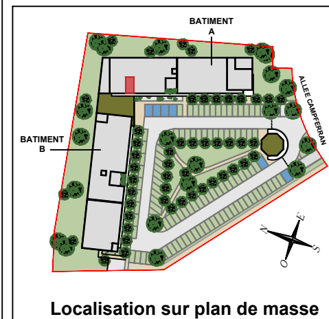
Localisation sur plan de masse

63 Allée Campferran 31 320 AUZEVILLE-TOLOSANE