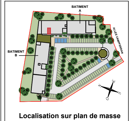
Localisation sur plan de masse

63 Allée Campferran 31 320 AUZEVILLE-TOLOSANE