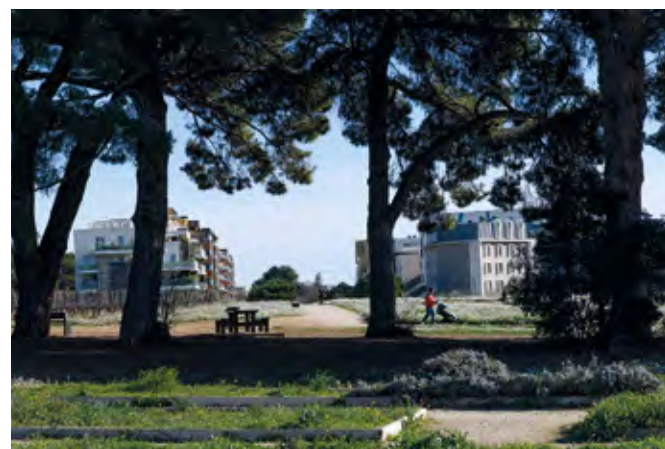
Les 18 hectares* de l'Agriparc du Mas Nouguier avec ses vignes, ruchers et grandes prairies autour d'une ancienne maison de maître.