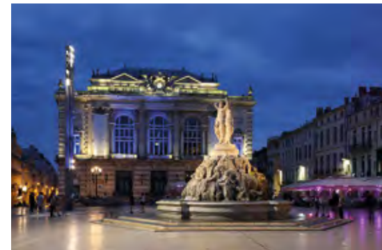
La place de la Comédie et le cœur historique en moins de 15 minutes* en voiture ou en tramway.