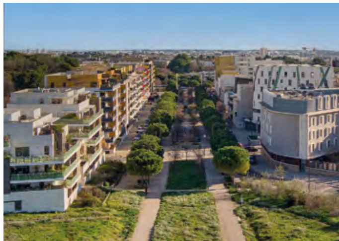
La rambla arborée des Calissons rejoignant le Mas Nouguier.