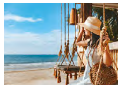
Les plages à quelques minutes* en voiture.