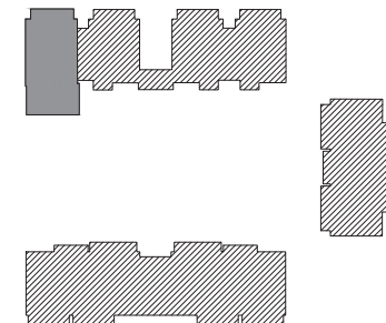
Tableau des surfaces