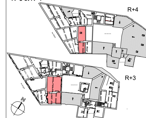
Tableau de surfaces