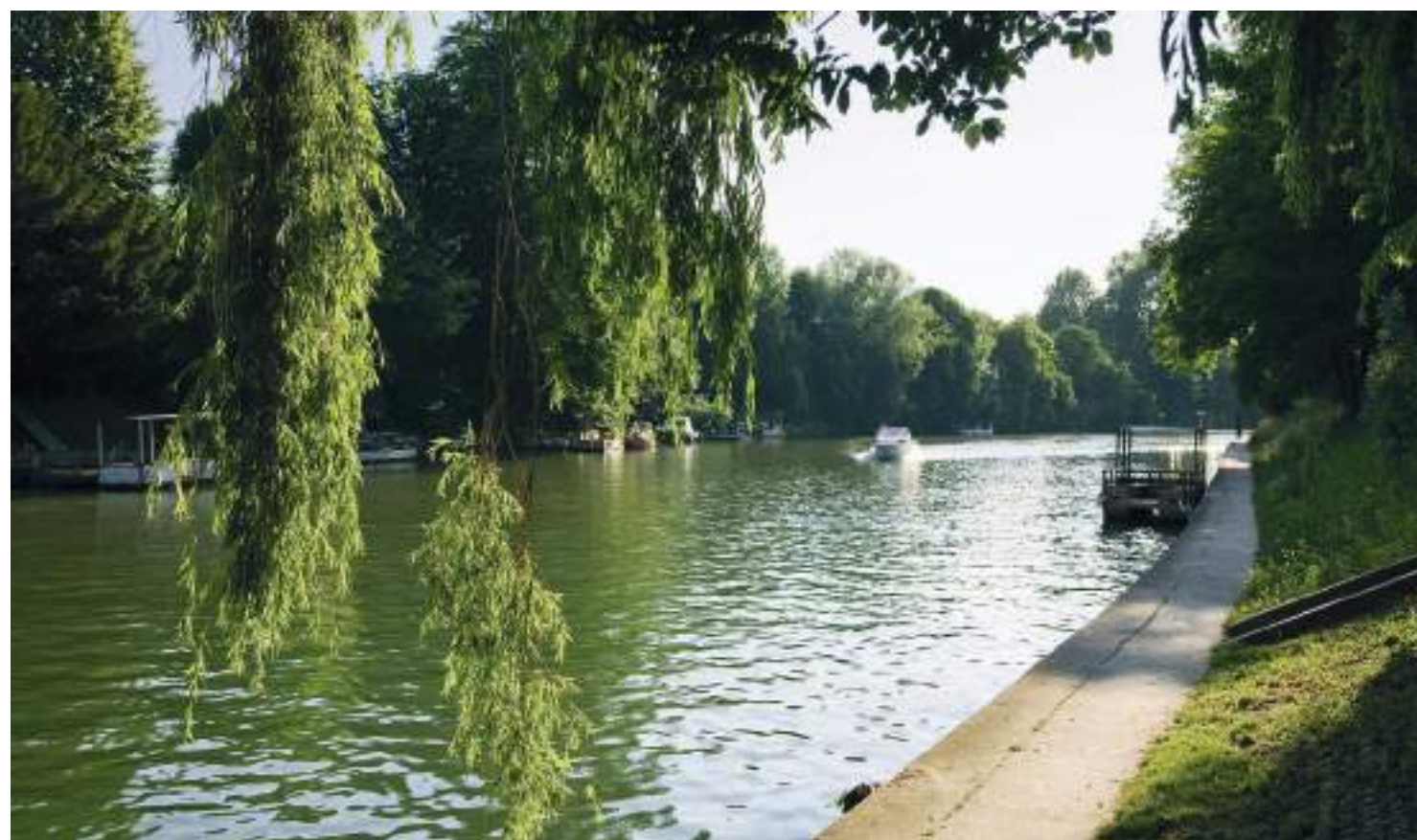
Bords de Marne à 6 min* à vélo de la résidence

Entre ville et nature, Le Perreux-sur-Marne a su trouver un équilibre parfait à deux pas de la capitale.